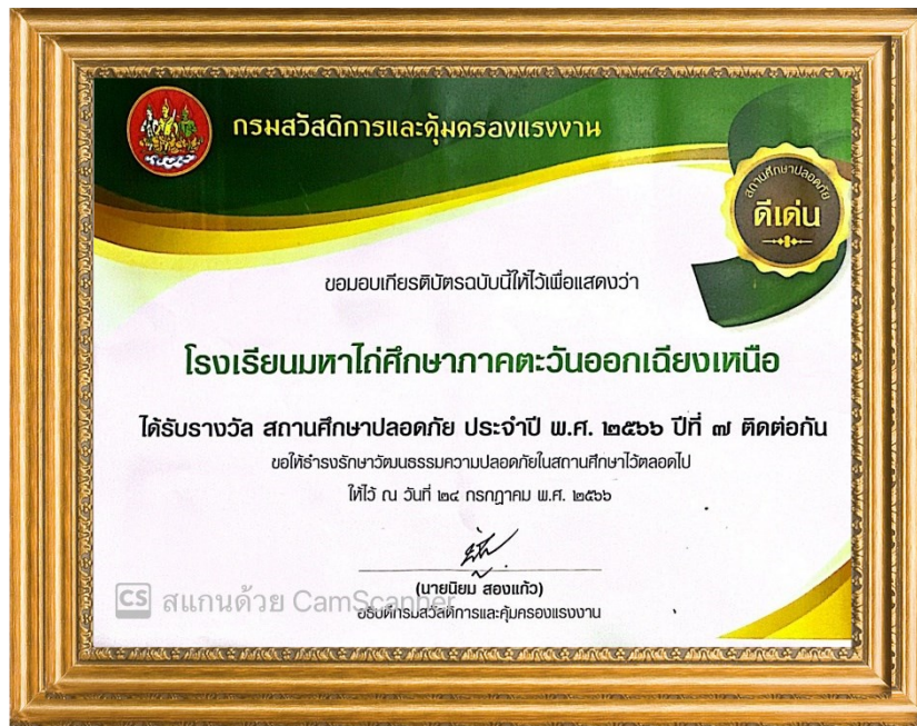
โรงเรียนมหาไถ่ศึกษาภาคตะวันออกเฉียงเหนือ ได้รับรางวัลสถานศึกษาปลอดภัยปีที่ ๗ ประจำปีการศึกษา ๒๕๖๖