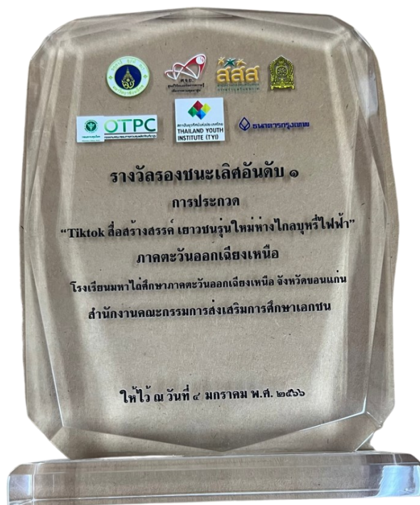
โรงเรียนมหาไถ่ศึกษาภาคตะวันออกเฉียงเหนือ ได้รับรางวัลรองชนะเลิศอันดับ ๑ ระดับประเทศ การประกวด TikTok สื่อสร้างสรรค์ เยาวชนรุ่นใหม่ทางไกลบุหรี